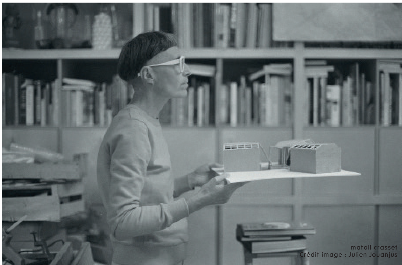
matali crasset

L'exposition de matali crasset « nous avons oublié le pain en chemin » à la Galerie Philippe Valentin en collaboration avec Galerie MICA x LAB convoque le vivant. Elle se présente en deux parties qui prennent place dans les deux espaces de la galerie, elle matérialise deux lectures récentes d'écologues.