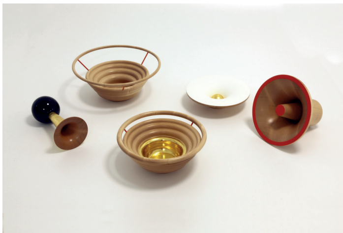
Infrasons matali crasset Atelier du Doreur x Prototype concept x Tournerie du Plat d'Or sycomore, feuille d'or, laque