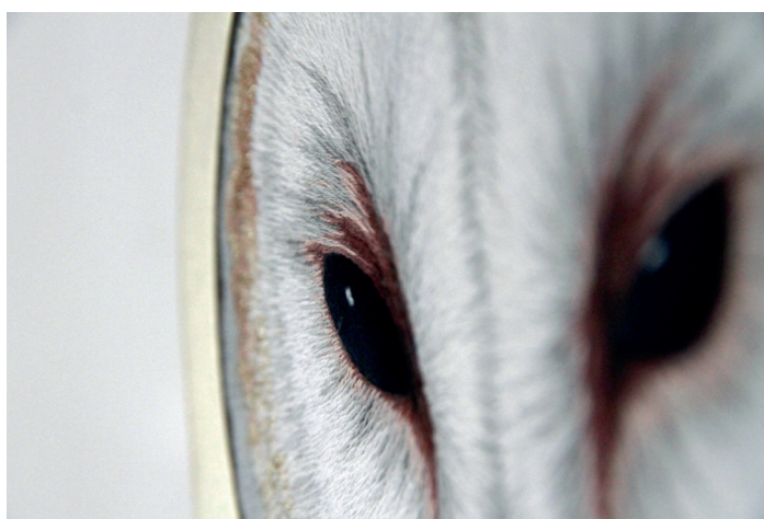
Effraie domestique matali crasset Brodeline x Crézê laiton, fil d'or et de coton