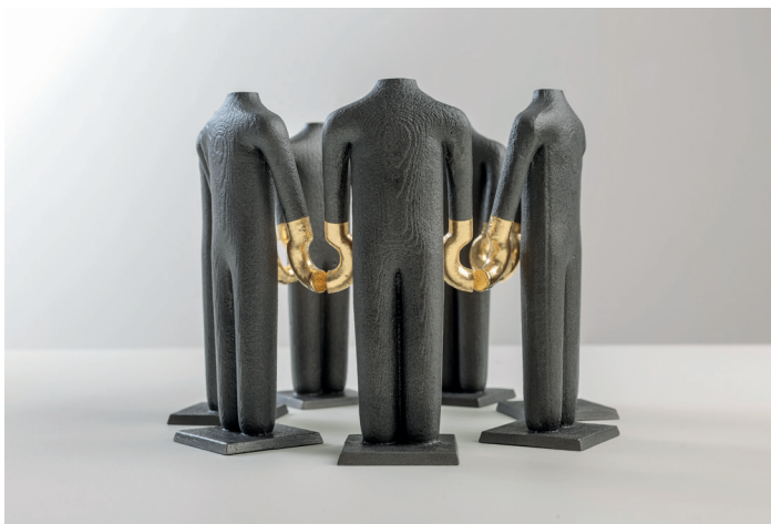
Transmission matali crasset Fondax x Atelier du Doreur fonte, feuille d'or